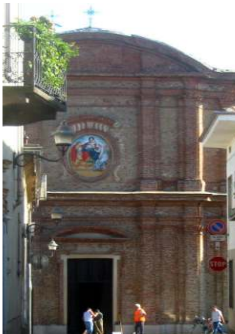
Scheda n° 5